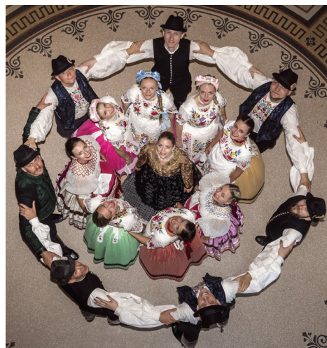
Vadrózsák från Ungern

Om det finns intresse, så gör vi en resa till Polen i månadskiftet juli/augusti. Men vi måste ha tillräckligt många intresserade redan nu i januari. Se separat info.